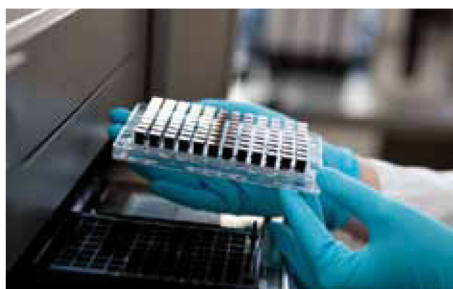
LIFE Labor – Genomweite Assoziationsstudie

Lebensbalance und Gesundheit haben in der heutigen Gesellschaft eine immer größere Bedeutung. Neben Ratgebern über Ernährung und Sport nehmen auch die Informationen über Krankheiten, wie Depression, Diabetes oder Herz-Kreislauferkrankungen zu.