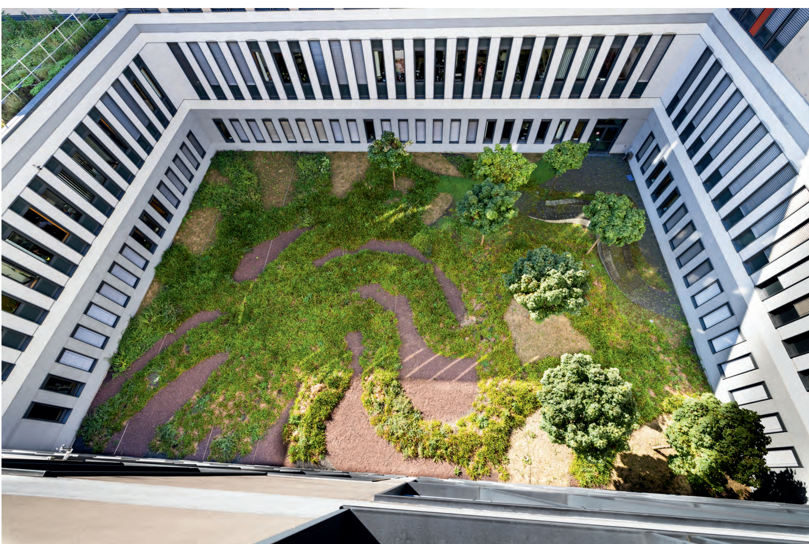
Lichthof Haus 6