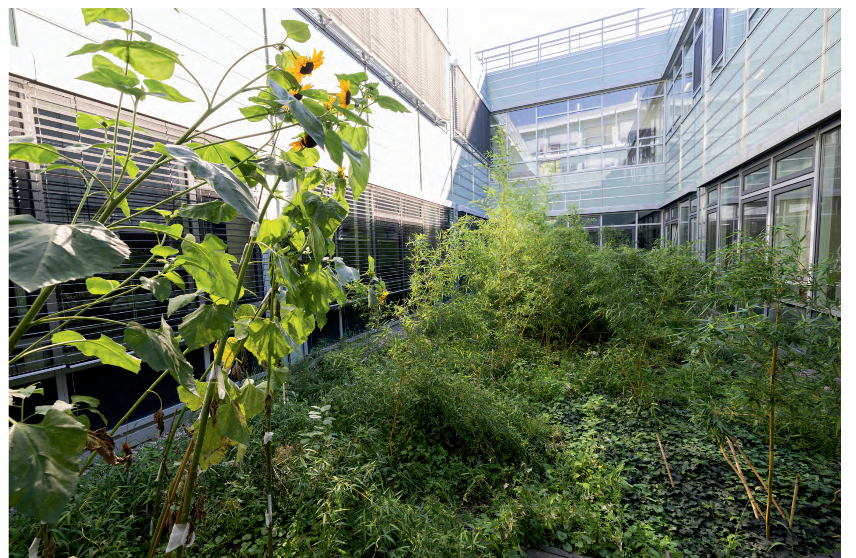
Bambushof Haus 4