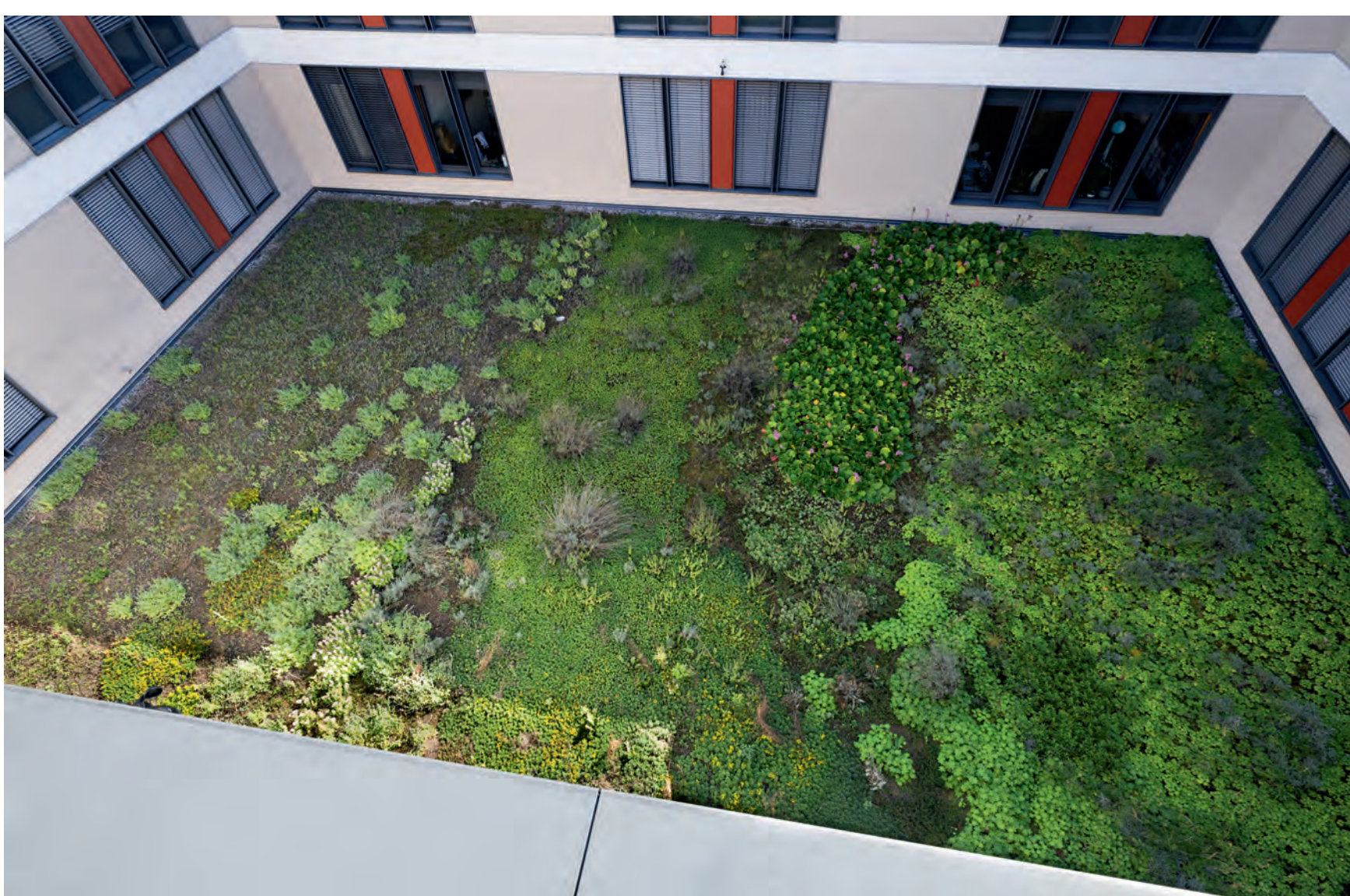
Lichthof Haus 6