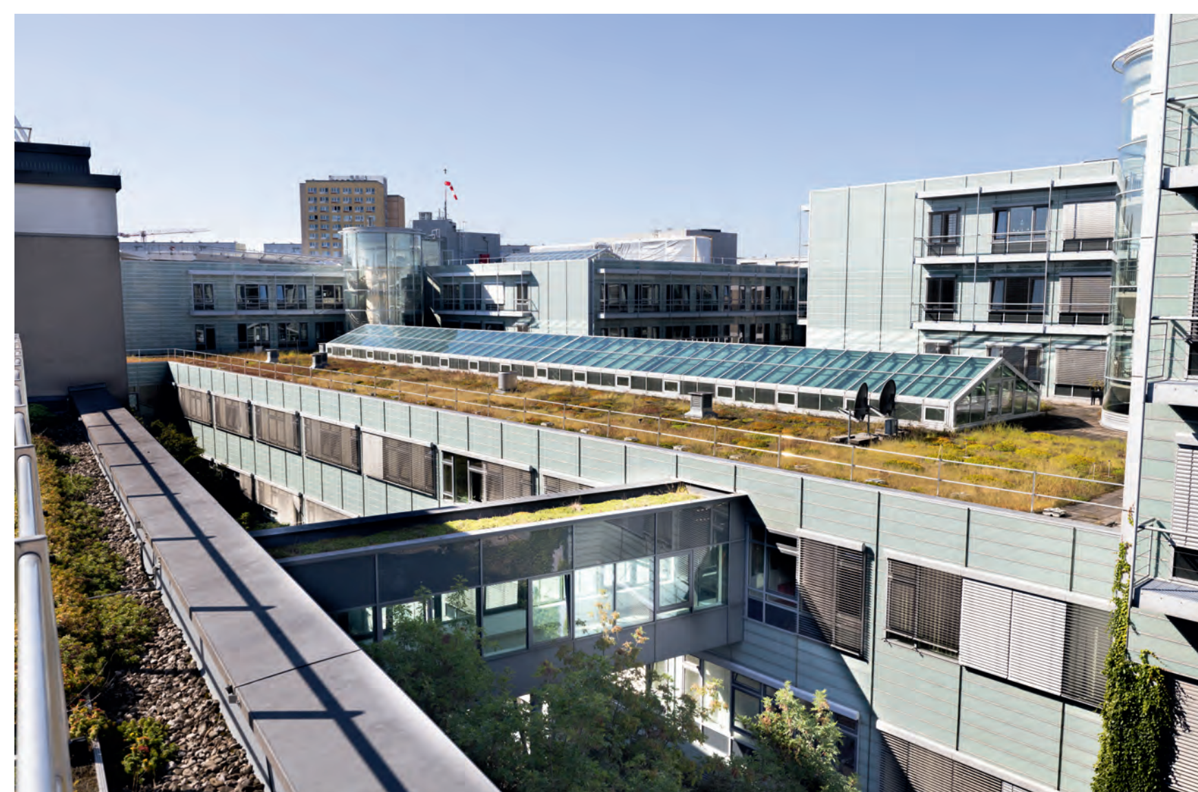
zwischen Haus 4 und Haus 6