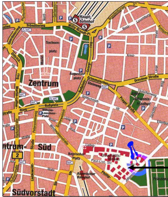
Medizinisches Viertel Liebigstraße

Detaillierter Lageplan des Medizinischen Viertel: