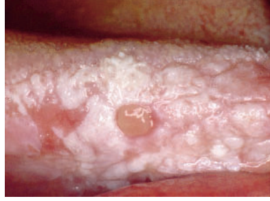
Abbildung 2 Das Bild zeigt eine inhomogene, in der Textur unruhige, stellenweise erhabene (Erythro-)Leukoplakie des rechten Zungenrandes. Am rechten Bildrand zeigt sich eine schmerzhafte Erosion. Der 80-jährige Patient ist Nichtraucher und trägt eine Totalprothese.

(Tab. 1-3, Abb. 1-8: T.W. Remmerbach, T. Riemer; Titel: S. Straube)