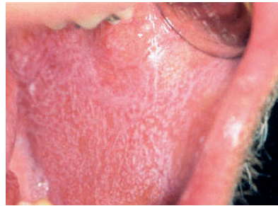
Abbildung 8 Es zeigt sich ein oraler Lichen vom papulären Typ im gesamten Bereich der linken Wange.

Die chirurgische Biopsie sollte an der klinisch zweifelhaftesten Stelle Läsion durchgeführt werden, die z. B. ei-