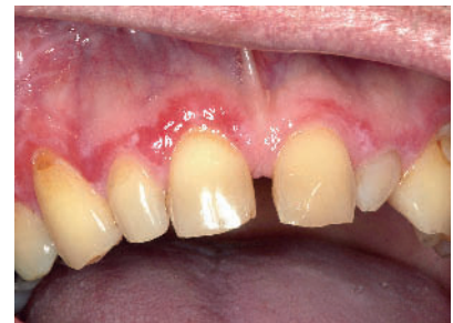
Abbildung 6 Gingivitis desquamativa bei einem Lichen-Patienten. Die Wickham-Streifung ist ebenfalls zu erkennen.