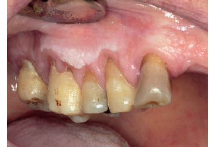
Abbildung 3 Es zeigt sich eine homogene Leukoplakie des rechten Alveolarfortsatzes, die auch nach Umstellung der Putztechnik persistierte. Der Patient ist Nichtraucher.