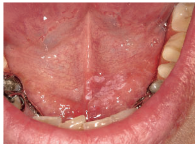
Abbildung 5 Es zeigt sich eine inhomogene Leukoplakie des vorderen Mundbodens mit kleinen erythroplakalen Arealen.