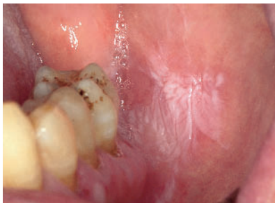
Abbildung 4 Das Foto zeigt eine inhomogene, teilweise gefelderte, teilweise schwammartig erhabene Leukoplakie der linken Wangenschleimhaut. Der Patient ist seit vielen Jahren Nichtraucher.