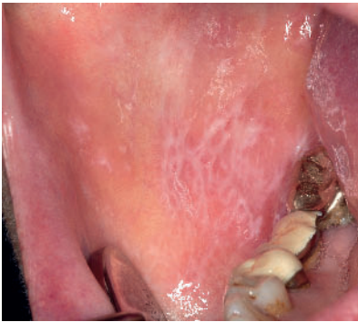
Abbildung 7 Klassische retikuläre Wickham-Streifung der rechten Wange bei oralem Lichen.

Figure 7 Reticular, a network of raised white lines or striae: lichen planus.