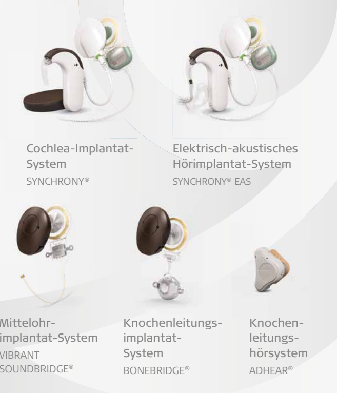
Cochlea-Implantat-System SYNCHRONY® Elektrisch-akustisches Hörimplantat-System SYNCHRONY® EAS Mittelohr-implantat-System VIBRANT SOUNDBRIDGE® Knochenleitungs-implantat-System BONEBRIDGE® Knochenleitungs-hörsystem ADHEAR®