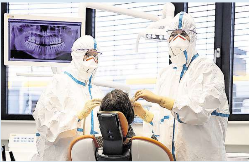
Am 7. April 2020 eröffnete das UKL eine zahnmedizinische Notfall-Ambulanz für Covid-19-Patient:innen in der Corona-Ambulanz.