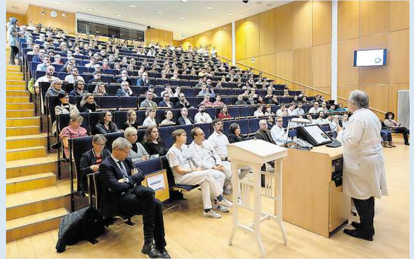
Informationsveranstaltung für Mitarbeiter:innen Ende Februar 2020 im Hörsaal von Haus 4.

Am 27. Februar ging die erste von insgesamt 152 Corona-Update-Mails über den internen Mailverteiler. Ziel dieser neuen Kommunikationsform: Die vielen, sehr schnellen Vorgänge im Haus transparent zu vermitteln und die Beschäftigten gut vorzubereiten. Denn die Pandemiepläne erwiesen sich als ungeeignet, alles musste neu gedacht werden. Im ganzen Klinikum liefen unzählige Prozesse gleichzeitig auf Hochtouren: Testungen wurden etabliert, Regelungen für den Umgang mit positiven Befunden erstellt, Abstimmungen mit anderen Kliniken und Behörden getroffen. Der Einkauf musste angesichts eines leergefegten Marktes dafür sorgen, dass das UKL mit den nötigen Schutzmitteln und Materialien ausgestattet wird. Diese Aufgabe, die uns die Arbeit erst ermöglichte, wurde zu einem echten Krimi. Denn die Pandemie nahm zwar langsam, aber doch stetig Fahrt auf: