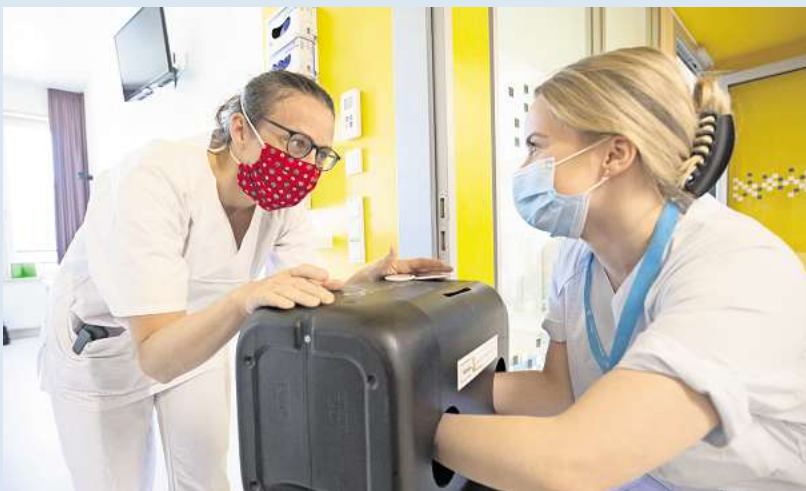
Sind die Hände wirklich sauber? Anhand dieses Apparats konnte im Kontext einer Hygieneschulung mit UV-Licht das Ergebnis abgelesen werden.