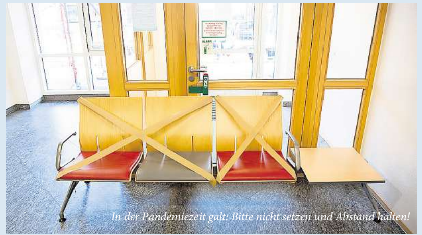
In der Pandemiezeit galt: Bitte nicht setzen und Abstand halten!